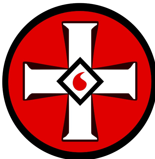
Рисунок 1. Эмблема ультраправой организации «Ку-клукс-клан»