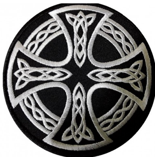
Рисунок 2. Кельтский крест. Символ многих расистских организаций