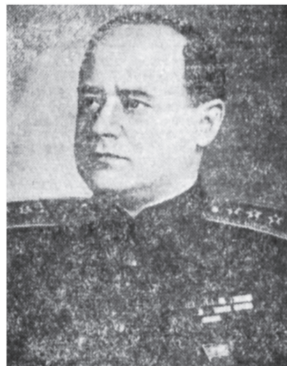
Адмирал флота И. С. Исаков.