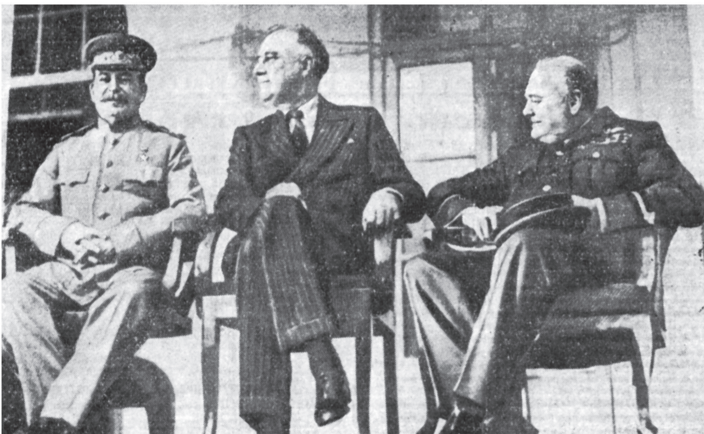
И. В. Сталин, Ф. Д. Рузвельт и У. Черчилль в дни Тегеранской конференции.

ВЕЧНАЯ СЛАВА ГЕРОЯМ, ПАВШИМ В БОЯХ С ВРАГОМ И ОТДАВШИМ СВОЮ ЖИЗНЬ ЗА СВОБОДУ И СЧАСТЬЕ НАШЕГО НАРОДА!