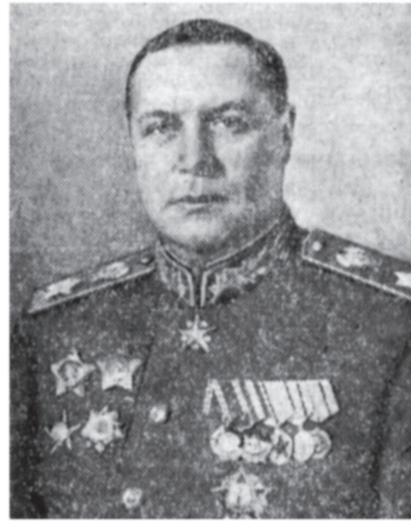
Маршал Советского Союза Ф. И. Толбухин.