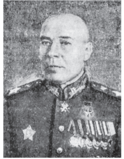
Маршал Советского Союза С. К. Тимошенко.