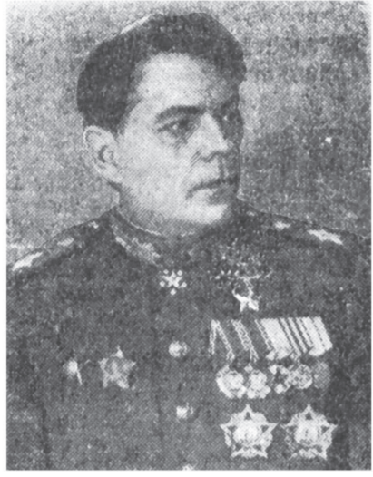
Маршал Советского Союза А. М. Васильевский.