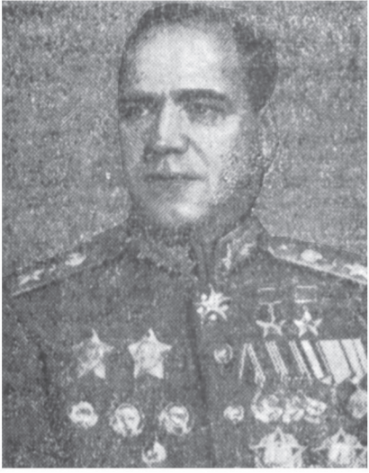
Маршал Советского Союза Г. К. Жуков.