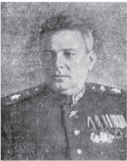
Маршал бронетанковых войск Я. Н. Федоренко.