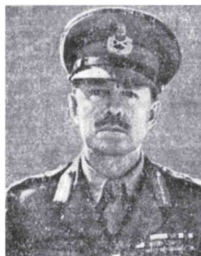
Фельдмаршал Г. Александер.