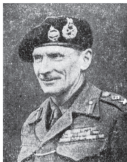
Фельдмаршал Б. Монтгомери.