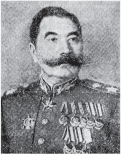
Маршал Советского Союза С. М. Буденный.