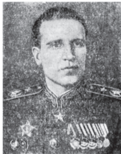
Главный Маршал авиации А. Е. Голованов.