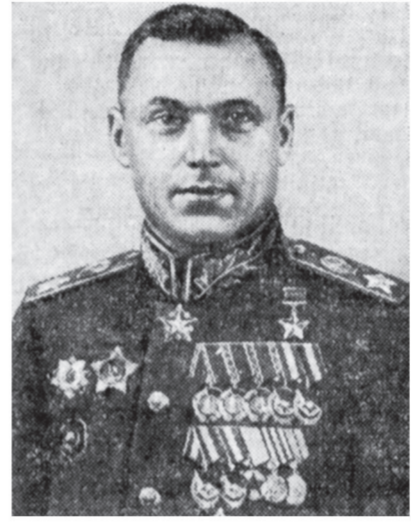
Маршал Советского Союза К. К. Рокоссовский.