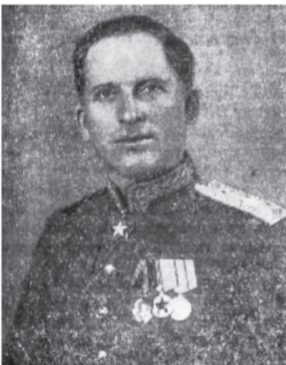
Маршал войск связи И. Т. Перешпкин.