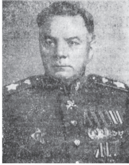
Маршал Советского Союза К. Е. Ворошилов.