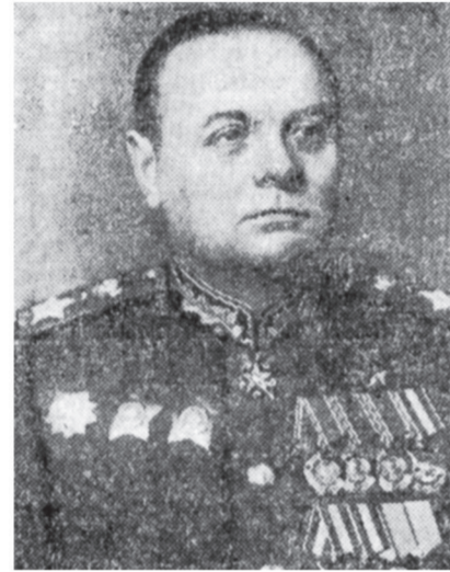
Маршал Советского Союза К. А. Мерецков.