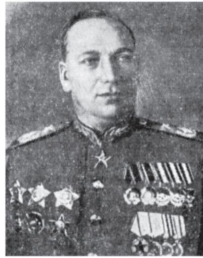
Главный Маршал артиллерии Н. Н. Воронов.