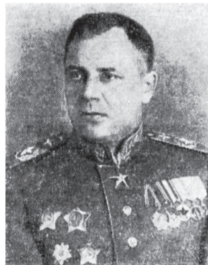
Главный Маршал авиации А. А. Новиков.