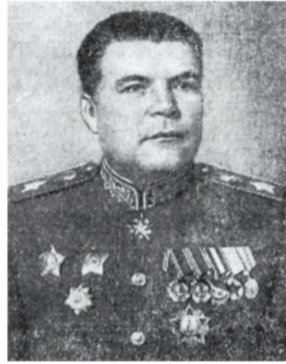
Маршал Советского Союза Р. Я. Малиновский.