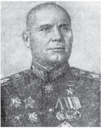
Маршал Советского Союза И. С. Конев.