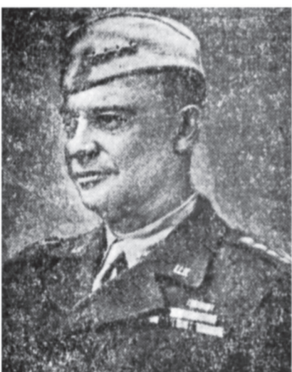
Генерал Д. Эйзенхауэр.