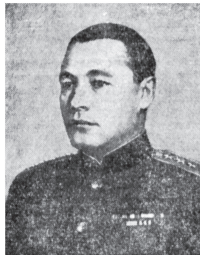
Адмирал флота Н. Г. Кузнецов.