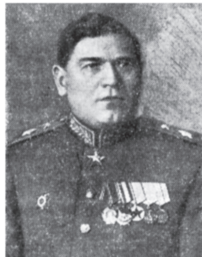
Маршал инженерных войск М. П. Воробьев.