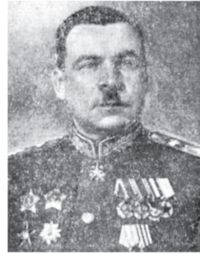
Маршал Советского Союза Л. А. Говоров.