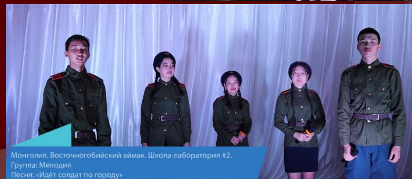
Монголия. Восточногобийский аймак. Школа-лаборатория #2. Группа: Мелодия Песня: «Идет солдат по городу»